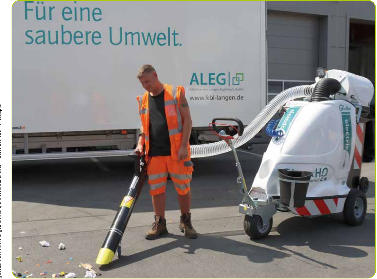
© Magistrat der Stadt Langen, Bauwesen, Stadtplanung, Umwelt- und Klimaschutz | gedruckt auf chlorfrei gebleichtem, umweltfreundlichem Papier aus 100 % Altpapier